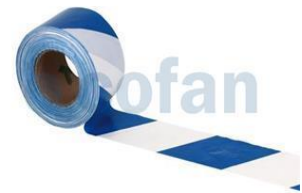
Cinta balizar del recorrido